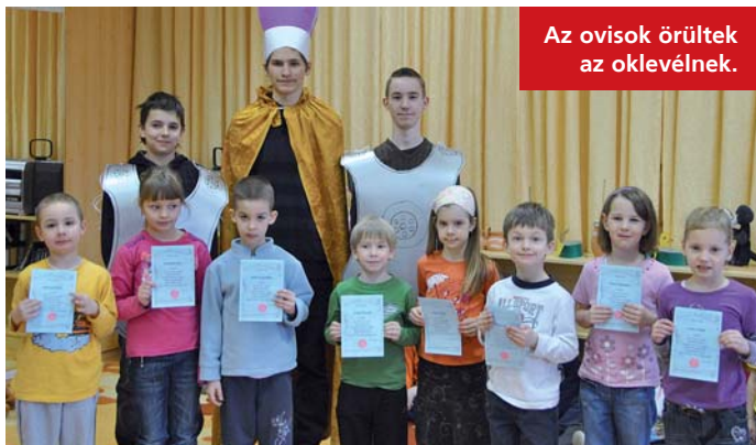
Az ovisok örültek az oklevélnek.

A gergelyezést IV. Gergely pápa (827–844) vezette be, az iskolák, diákok egyik védőszentje, Nagy Szent Gergely (szül. Róma, 540 körül – megh. Róma, 604. március 12.) tiszteletére. Az ünnepet Gergely napon tartották meg, amikor a falusi iskolás gyerekek házról-házra jártak, miközben daloltak és különböző szereposztások játékokat adtak elő. Céljuk az iskolába még nem járó gyerekek befogása és a tanítónak szánt ajándékok összegyűjtése volt.