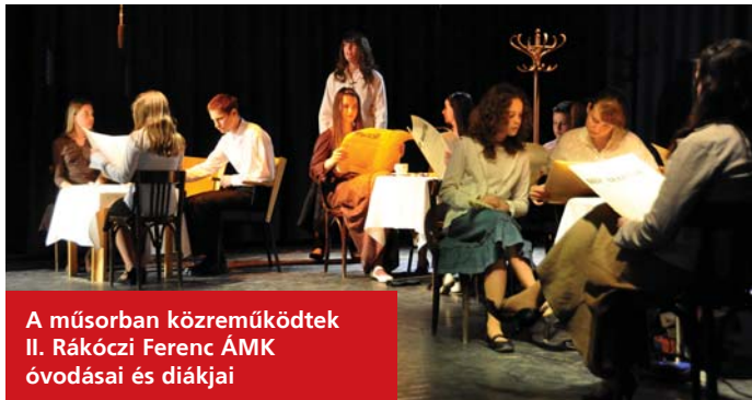
A műsorban közreműködtek II. Rákóczi Ferenc ÁMK óvodásai és diákjai