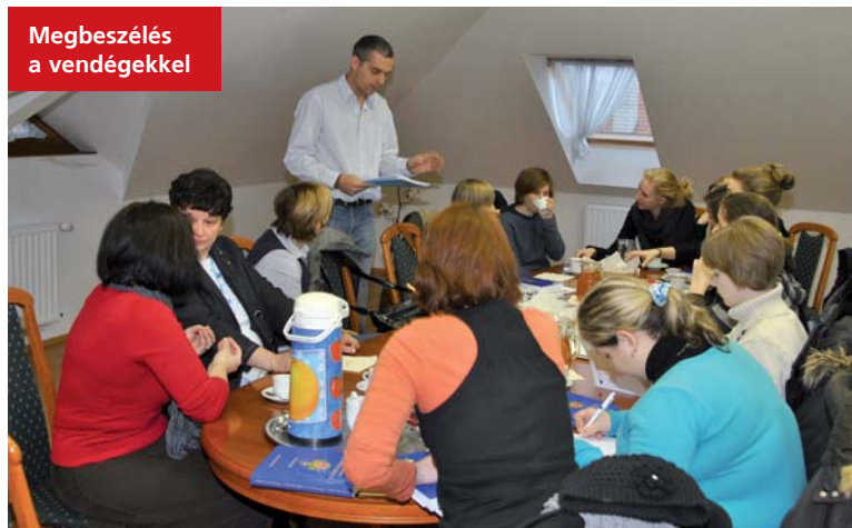
Megbeszélés a vendégekkel

tézményegység-vezető helyettesek fogadtak bennünket. A nap zárásaként ismét a pedagógiai szakszolgálat intézményegységében a projekt résztvevői kérdéseket tehettek fel és elmondhatták tapasztalataikat. A szerdai és a csütörtöki nap is hasonló forgatókönyv szerint zajlott. A három nap során 26 tanórát illetve foglalkozást látogathattak meg vendégeink. A hospitálások mellett jutott idő a