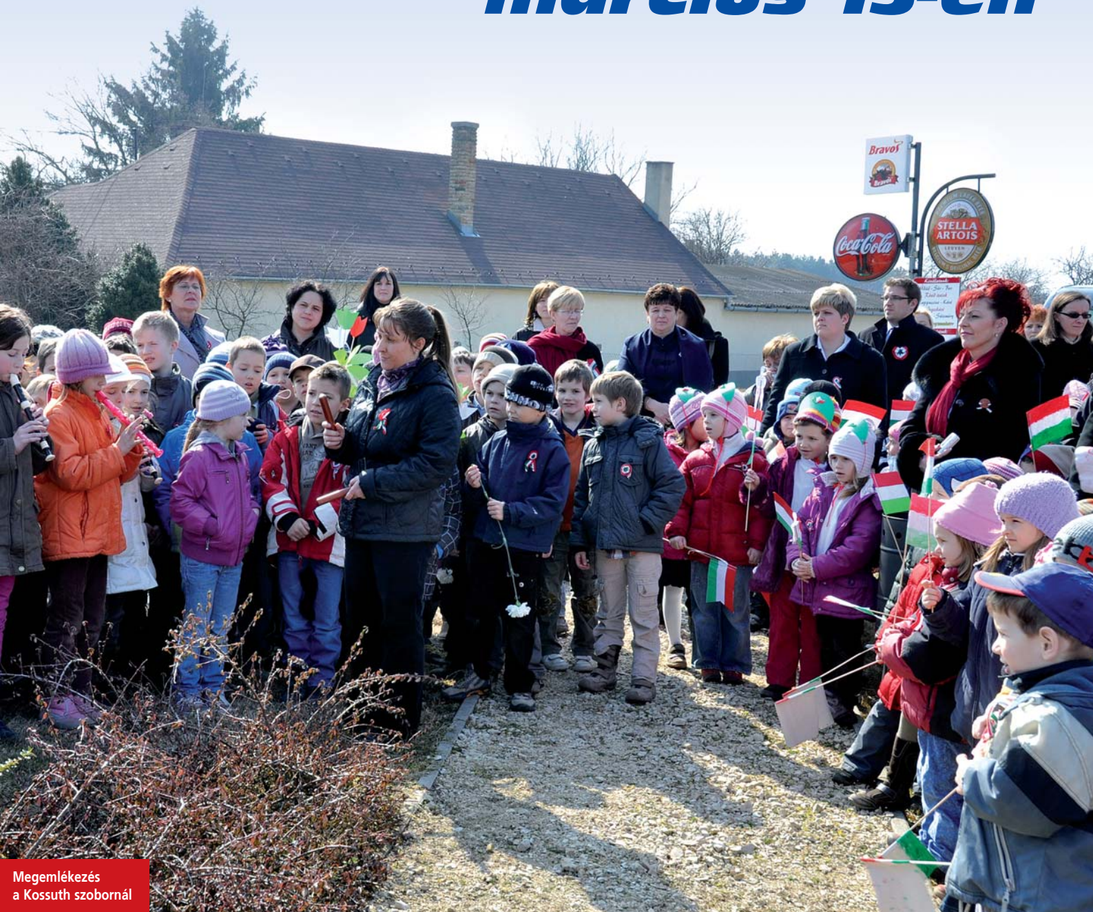
Megemlékezés a Kossuth szobornál