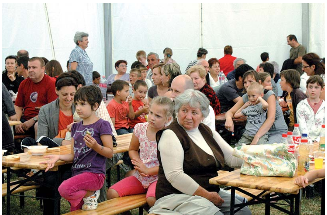
Sok látóval kínálta a közönségnek a zöld nap

Impresszum. Baráti Hírmondó. Kiadja: Győrújbarát község önkormányzati képviselő-testülete. 9081 Győrújbarát Liszt Ferenc út 9. Telefon 96/543 651, fax: 96/355 044. Megjelenik havonta. Felelős kiadó: a szerkesztőbizottság vezetője Győrújbarát Község jegyzője. Felelős szerkesztő: Németh Endre. Tördelés, grafika: Konrád Kiadványszerkesztő Kft. Nyomda: Eco-Press, Győr.