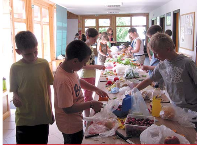
Készülnek a zöldségszobrok

Egész évben keményen tanultunk, felmérőket írtunk, ezért nagyon vártuk azokat a napokat, amikor egy kicsit lazábban vehetjük a dolgokat. Megérte a várakozás, mert idén sem csalódtunk a Program 7 rendezvényeiben.