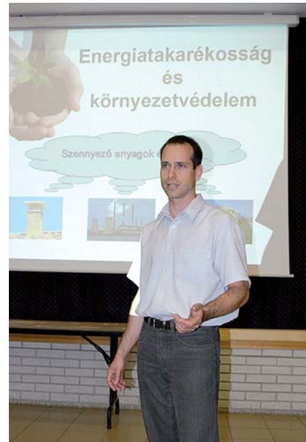
Előadást is hallhattak az érdeklődők

A nap azonban nem múlhatott el a finom étek nélkül. Közszönjük a civil szervezetek segítségét, akik felajánlották a bográcsban készült finomságokat. A Baráti Nyugdíjas klubnak a Baráti nyugdíjas paprikást, a Győrújbaráti Labdarugó egyesületnek a finom marhapörköltet, a Német-Magyar Baráti Társaságnak a vegyespörköltet és süteményeket, a Francia-