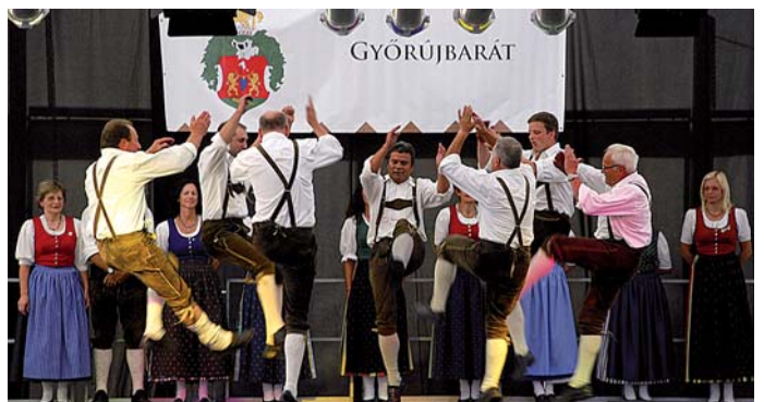
A vendégek Loipersdorfból