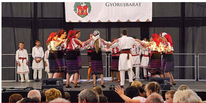
A csángó csoport tánca

A műsor utáni ünnepi vacsorán látszott a vendégeken,