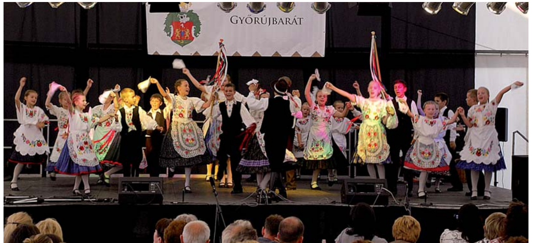
Nagy sikere volt a kis csobolyósoknak

És itt engedjen meg nekem némi nosztalgiát a kedves olvasó, hogy visszaidézzem azokat a fesztiválokat melyek településünkön Mexikótól Kínáig, Görög és Törökországtól Szenegálig vonultatták fel a világ nemzeteit, nem beszélve az ör-